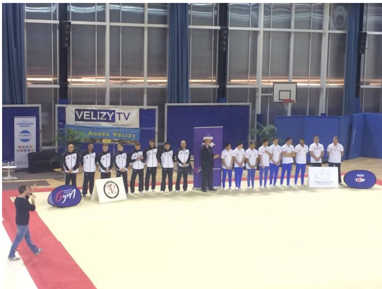
Les deux équipes : Vélizy et Antibes.

format du Top 12. En face, Antibes sortait d'une victoire solide face à Montceau-Les-Mines.